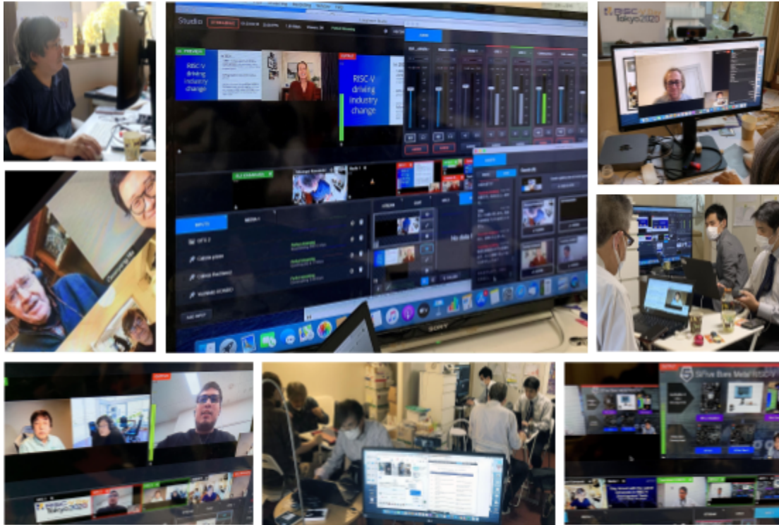
図2 オンプレミスのスタジオ風景（RISC-V Day Tokyo 2020 11/5-6 より）