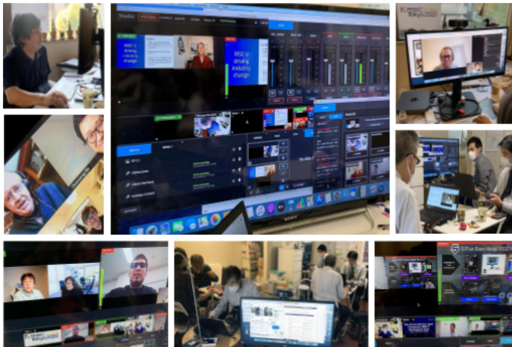
図2 オンプレミスのスタジオ風景 (RISC-V Day Tokyo 2020 11/5-6 より)